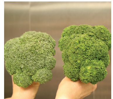
Mano izquierda: lavados con agua solamente. Mano derecha: lavados con AFVT.