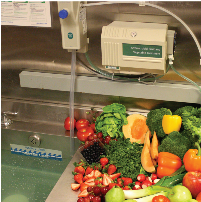
AFVT lava los residuos de cera del producto y lo hace ver más atractivo.